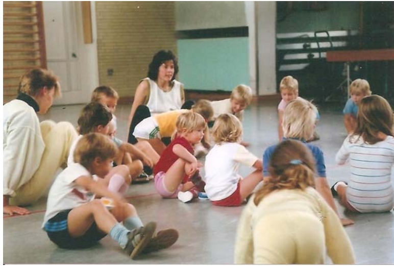
„Uli-turnen“, hier noch in der kleinen Turnhalle an der Schule

fähigkeit entwickelt und verbessert. Erfolgserlebnisse tragen dazu bei, dass sich Kinder mit mehr Freude und häufiger bewegen, folglich mehr Bewegungssicherheit entwickeln und daraus Selbstsicherheit und Selbstbewusstsein schöpfen können. Dies gilt jedoch nicht nur für das Kleinkinderturnen sondern für alle weiteren Sportgruppen auch. Die Entwicklung und Verbesserung der allgemeinen Bewegungs- und Leistungsfähigkeit ist das Ziel jeden Sportlers.