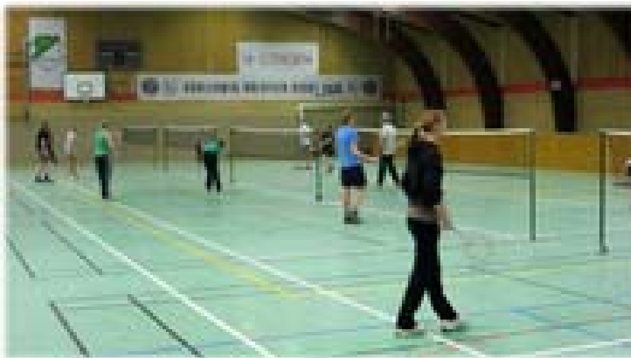
Badminton Just for Fun