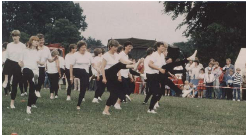
Show-Veranstaltung unserer Damen-Gymnastikgruppe 1985

Der TSV Hattstedt baut auf ein vielfältiges Angebot an Sportmöglichkeiten im Bereich Turnen und Gymnastik. Dies beginnt mit dem Eltern-Kind-Turnen . Hier machen bereits die Kleinsten in Begleitung von Mama, Papa, Oma oder Opa erste spielerische Erfahrungen in der Turnhalle. Bereits 1981 wurde die Mutter-Kind-Turngruppe im TSV Hattstedt gegründet und erfreut sich seitdem einer gleich bleibenden Beliebtheit.