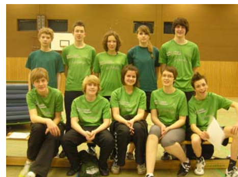
Jugendmannschaft der Leichtathleten