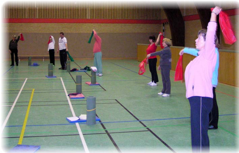
Wirbelsäulengymnastik in der Halle

Die Stunden werden abwechslungsreich gestaltet, und jeder Teilnehmer kann nach seinem eigenen Leistungsstand üben. Als Trainingsunterstützung setzen wir verschiedene Kleingeräte wie Pettzi-Ball, Theraband, Balancekissen und Hanteln ein, um im Stehen, im Sitzen oder im Liegen zu turnen. In die Übungsstunde fließen Elemente aus Spaß, Joga, Pilates und Feldenkreis mit ein. Es ist jeder herzlich eingeladen bei uns mitzumachen.