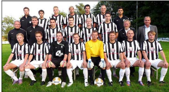
Die 1. Herrenmannschaft des TSV Hattstedt im Jubiläumsjahr