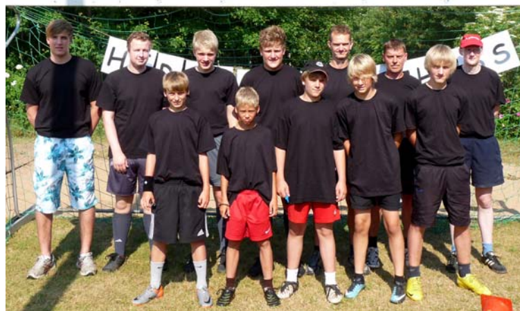
Schiedsrichter aus Hattstedt und Arlewatt bei der Mini-WM