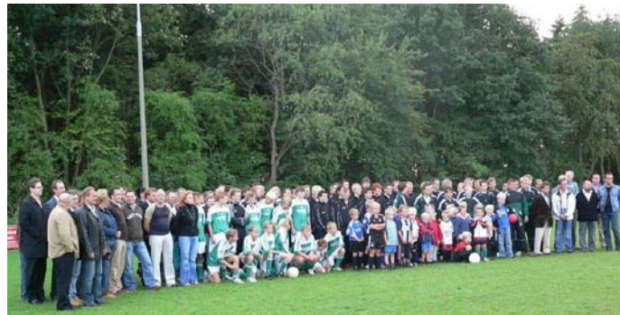
Fußballer des TSV Hattstedt bedanken sich bei den Sponsoren