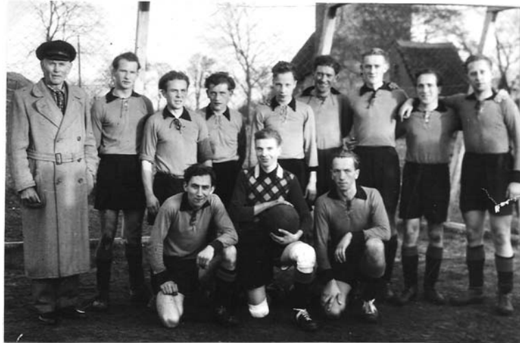
Herren-Fußballmannschaft von etwa 1950