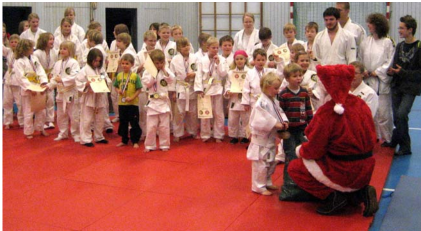
Unsere Jiu-Jitsu Gruppe bei einer Weihnachtsveranstaltung